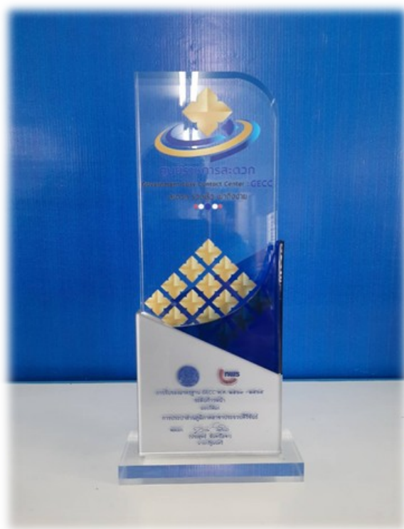
โล่รางวัลศูนย์ราชการสะดวก GECC : Government Easy Contact Center