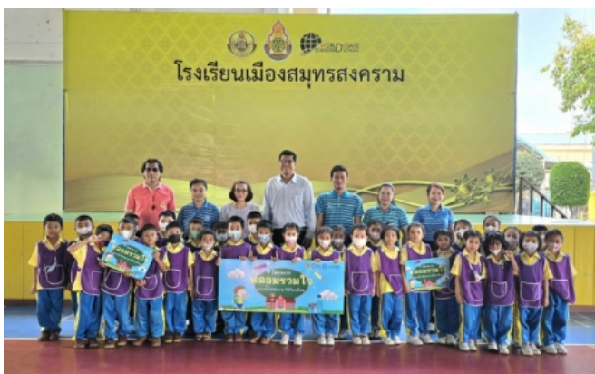
โครงการหาลอมรวมใจมอบน้ำใสให้โรงเรียน

นอกจากนี้ กปภ.สาขาสมุทรสงคราม ยังมีการพัฒนาหน่วยงานอย่างสม่ำเสมอ มีการจัดทำโครงการต่างๆ เพื่อสร้างความมั่นใจในด้านคุณภาพน้ำและด้านบริการแก่ผู้บริโภค